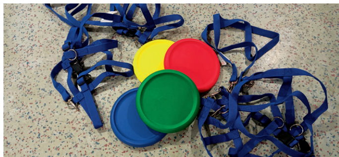
Neues für die Pausenkisten

Gutschein zum 25-jährigen Bestehen der Astrid-Lindgren-Schule Die Gemeinde hat der Schule zum 25-jährigen Bestehen einen Gutschein zukommen lassen.