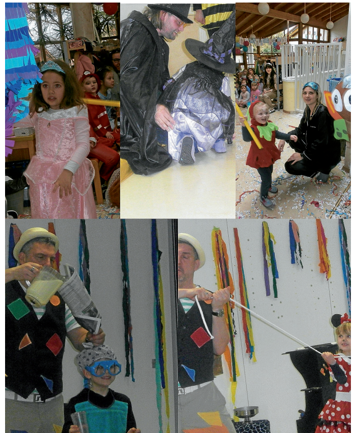
Eindrücke aus der Faschingszeit

Als Erstes wurden die Kostüme der Kinder mit dem Lied: „Und wer als Tier gekommen ist, tritt ein“ betrachtet. Hier gab es viele wundervolle und sehr unterschiedliche Kostüme zu bewundern.