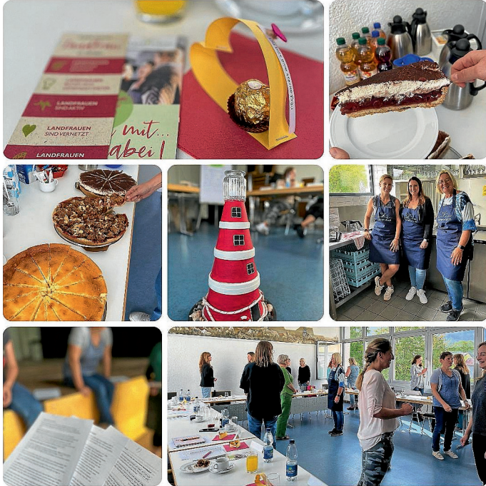
Seminar Leuchtturm Mama