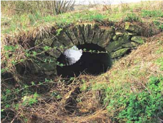
Steinbrücke über den Wagenbach im Gewinn Kirrloch

Im Jahr 2011 wurde dieses Projekt von der Koordinationsstelle auf Kreisebene vorgestellt. Die Koordinationsstelle für das Projekt war seither beim Landesamt für Denkmalpflege angesiedelt. Hier wurden die erhobenen Daten systematisiert und bearbeitet, damit sie genutzt werden können.