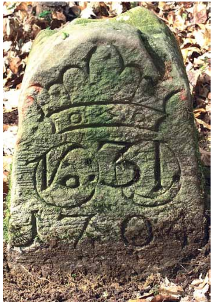
Grenzstein im Mühlwald

Das Ziel des landesweiten Projektes war eine möglichst flächendeckende, systematische Bestandsaufnahme aller Kleindenkmale, um die Kleindenkmale verstärkt ins öffentliche Bewusstsein zu rücken. Damit soll ein besserer Schutz, eine verstärkte Beachtung und die notwendige Sicherung und Pflege der Kleindenkmale erreicht werden. Zudem dient die Erfassung als Grundlage für eine wissenschaftliche Untersuchung und die Bewertung der Denkmaleigenschaft im Sinne des Denkmalschutzgesetzes.