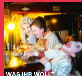
WAS IHR WOLLT