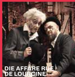
DIE AFFÄRE RUE DE LOURCINE