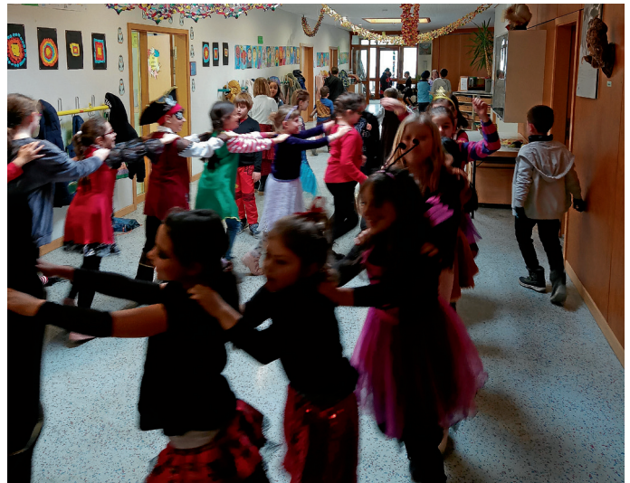
Helau und Alaaf!

Das Kollegium der Astrid-Lindgren-Schule