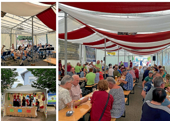
Rückblick Dorffest 2024