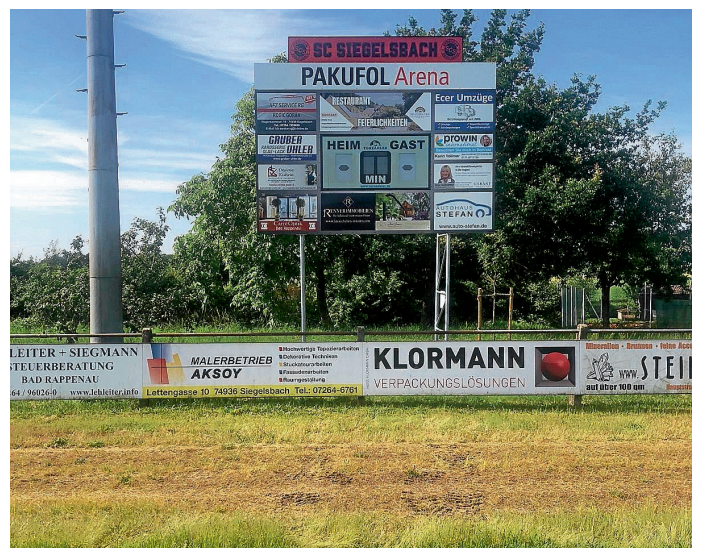
Schriftzug Pakufol Arena auf dem Torzähler

Pakufol Folienprodukte GmbH produziert seit mittlerweile zehn Jahren in einem Teil des ehemaligen Bundeswehrdepots Folienprodukte und ist somit nur ein paar hundert Meter vom Sportgelände entfernt. Wir danken der Pakufol Folienprodukte GmbH für ihr Engagement, der Gemeinde Siegelbach für die Freigabe, der Vergabe der Namensrechte sowie dem Bauhof bei der Hilfe der Montage. Die Einnahmen kommen der Jugendabteilung zugute.