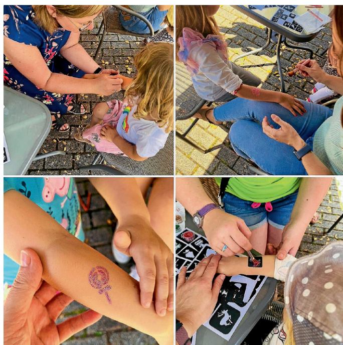
Dorffest Stand Förderverein

Am vergangenen Wochenende fand das 17. Siegelsbacher Dorffest statt. Auch der Förderverein Kindergärten und Grundschule Siegelsbach e.V. war mit tollen Kinderangeboten dabei. Es gab reichlich Glitzertattoos und lustige Ballontiere. Wir hoffen, alle Kinder hatten viel Spaß und bedanken uns bei allen Besuchern.